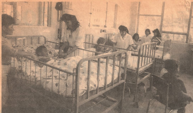
El Hospital Pablo Tobón Uribe, tiene una atención especial en los pabellones pediátricos.

Antes de hablar de la financiación, vale la pena resaltar que allí se tienen dos modalidades de atención: pensionados y clasificados socio-económicamente. En este servicio se atienden todos aquellos pacientes que debido a su situa-