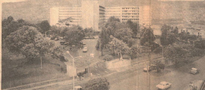
Imponente panorama de las instalaciones del Centro Hospitalario Pablo Tobón Uribe en Medellín.

La cirugía puede ser ambulatoria, y sin embargo cuenta con un área especial para acompañantes. Hay nueve quirófanos y el más alto nivel