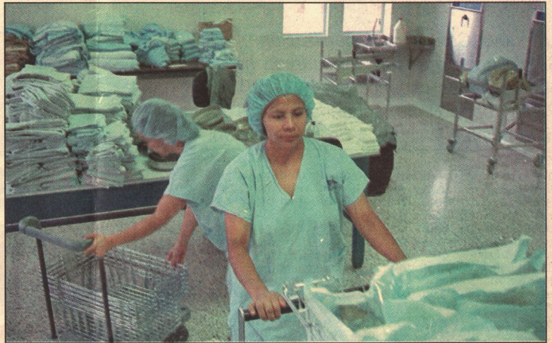
Los equipos utilizados en la Central de Esterilización y Suministros son importados en su mayoría, aunque algunos fueron diseñados y fabricados por colombianos.

Para almacenar los materiales de hospital se requiere de cierto aprovechamiento del espacio. Es por esto que la Administración de la institución contrató un ingeniero de Procesos para que asesorara la compra y organización del equipo que se requería. «Tratamos de utilizar muy bien los espacios y de buscar la mayor eficiencia para no perder la inversión», según Celina Gómez. En esta área hay una serie de canastas donde se almacena el material esterilizado y listo para ser distribuido en todo el hospital.