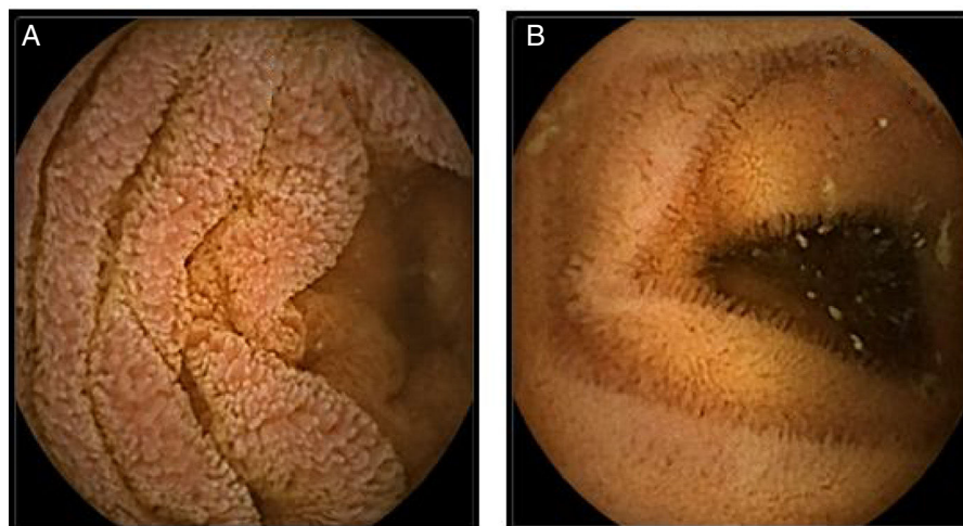
Figura 2 Cápsula endoscópica. A) Mucosa con edema, eritema que produce engrosamiento de vellosidades. B) Control con desaparición del edema y eritema con normalización del grosor de las vellosidades.

de compromiso en profundidad; en el caso de compromiso superficial frecuentemente se observa dolor abdominal, náuseas, vómito o diarrea, pero pueden presentarse síndromes malabsortivos, enteropatía perdedora de proteínas y pérdida de peso. La infiltración de las capas profundas de la pared lleva a engrosamiento y alteración en la motilidad, por lo que puede presentarse obstrucción intestinal. Cuando se compromete la subserosa, muy infrecuente, se presenta ascitis eosinofílica 6 , como lo descrito en nuestro caso 2,4,7 .