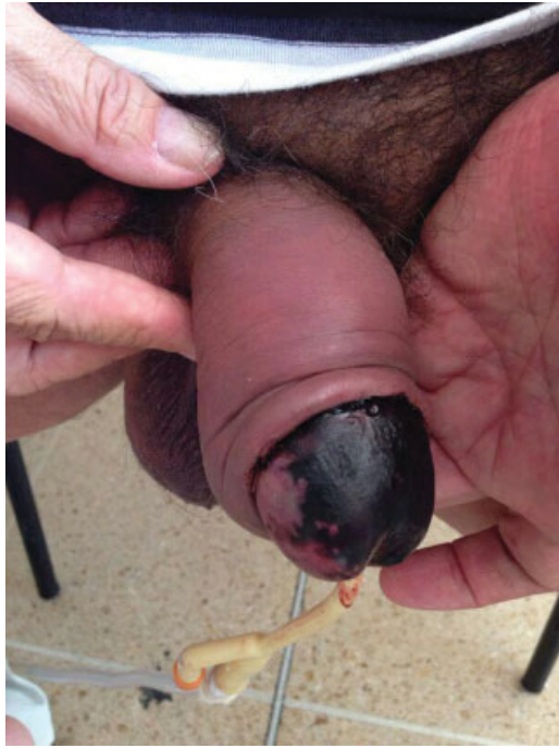
Fig. 1 Áreas necróticas en piel de glande. Sutura en surco balanoprepucial sana.

albugínea y se realizó la rafia de los cuerpos cavernosos con sutura continua con vicryl 3/0. Se calibró la uretra con bugía de Hegar # 7 y se realizó el cierre dorsal de la mucosa uretral con 6 puntos separados con vicryl 4/0 libres de tensión. Se pasó una sonda Foley de silicona 14Fr. Posteriormente, se avivaron los