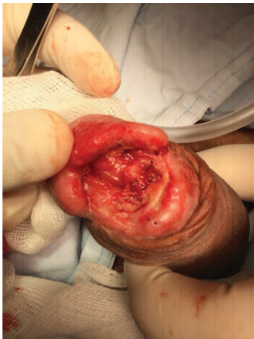
Fig. 2 Presentaba desprendimiento del glande en un 80% con áreas de necrosis en surco balano-prepucial del lado izquierdo, lesión de uretra en su parte distal y apertura del cuerpo cavernoso izquierdo. Se realizó lavado más desbridamiento de tejido necrosado y se fijó el glande al cuerpo cavernoso con punto de vicryl 3/0.

albugínea y se realizó la rafia de los cuerpos cavernosos con sutura continua con vicryl 3/0. Se calibró la uretra con bugía de Hegar # 7 y se realizó el cierre dorsal de la mucosa uretral con 6 puntos separados con vicryl 4/0 libres de tensión. Se pasó una sonda Foley de silicona 14Fr. Posteriormente, se avivaron los