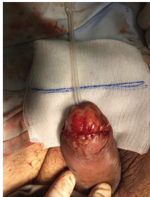
Fig. 4 Se realizó uretroplastia con cierre dorsal de la mucosa con vicryl 4-0 con 6 puntos separados libres de tensión previo al paso de sonda Foley de silicona 14 fr. Puntos hemostáticos de afrontamiento del glande por planos con vicryl 3-0.

Se describe el caso de un paciente que presentó necrosis de pene posterior a un priapismo inducido por la inyección