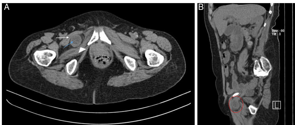
Figura 2 – A. Tomografía axial computarizada de abdomen sin contraste. Se evidencia asa de intestino delgado (flecha azul) entre los músculos pectíneo derecho (flecha blanca) y obturador externo derecho (punta de flecha). Obsérvese el engrosamiento de la pared del asa intestinal herniada. B. Tomografía computarizada (corte sagital) que muestra herniación del intestino delgado por agujero obturador (círculo rojo).

La semiología de la HO es compleja, dada la localización anatómica del defecto herniario (lo que explica la inespecificidad de síntomas y signos). Se menciona que incluso el diagnóstico de esta entidad suele ser intraoperatorio hasta en 2/3 de los afectados 3 .