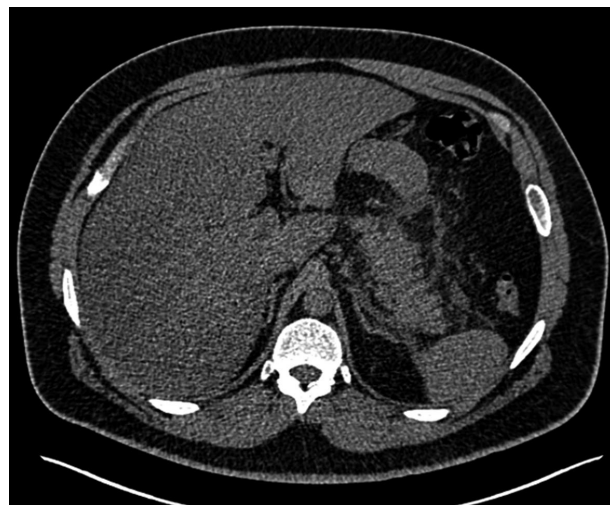
Figura 1. Pancreatitis aguda Baltazar C

Durante su evolución en el servicio de urgencias persistió el dolor abdominal, por lo cual se hizo una tomografía contrastada de abdomen, en la que se encontró una pancreatitis aguda Baltazar C (figura 1), con amilasa sérica de 38 U/L (rango de referencia 25-125 U/L), y lipasa sérica de 396 U/L (rango de referencia 5-51 U/L), por lo cual se dejó sin alimentos por vía oral y se trasladó a la unidad de cuidados especiales para el tratamiento de la pancreatitis y la CAD.